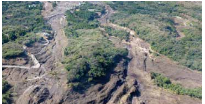
「平成 25 年台風第 26 号伊豆大島の土砂災害の概要」(国土交通省)より抜粋